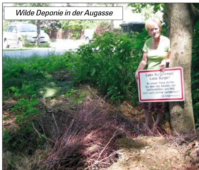
Wilde Deponie in der Augasse

Stattfinden wird diese Beratung vorerst immer am ersten Dienstag im Monat in der Zeit zwischen 17 und 19 Uhr im Gemeindeamt Katzelsdorf. Um Voranmeldung wird gebeten unter 02622/78200 oder per mail: gemeinde@katzelsdorf.gv.at . Je nach Interesse wird auch überlegt, gemeinsam mit der Energieberatung NÖ eine kostenlose Beratung direkt bei ihrem Bauprojekt anzubieten.