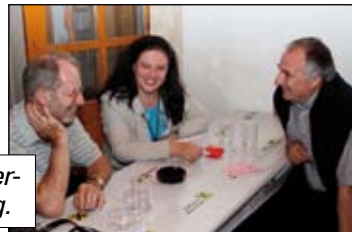
Alle Besucher unterhielten sich prächtig.