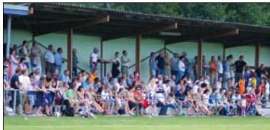
Abschlusstabelle 1. Klasse Süd 2009/10