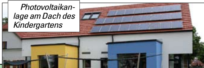
Photovoltaikanlage am Dach des Kindergartens