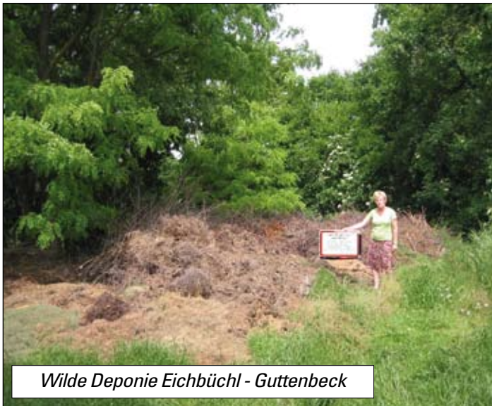
Wilde Deponie Eichbüchl - Guttenbeck

In Katzelsdorf gibt es eine Kompostanlage, die von März bis November am Wochenende geöffnet ist. Außerdem können die meisten Gartenabfälle im eigenen Garten kompostiert werden.